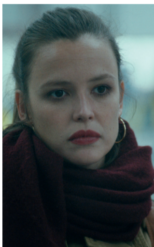
"Oysters" de/by Maia Descamps