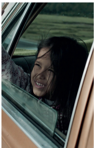
"Mia" de/by Karina Minujin

Convidamos todas as pessoas para a nossa revolução e para muito cinema.