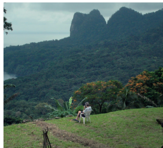
"Understory" de/by Margarida Cardoso | Portugal | 2019 | 85'

The Porto Femme - International Film Festival returns to Porto from April 16th to 21st, in a year where screens are revolutions!