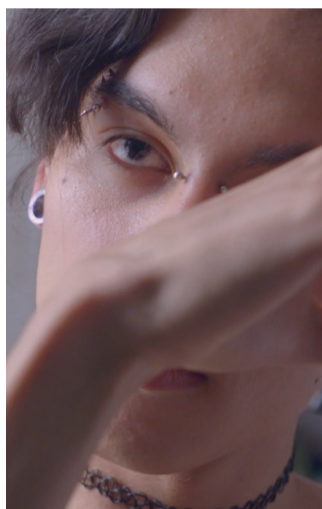
"Uli" de/by Mariana Gil Ríos